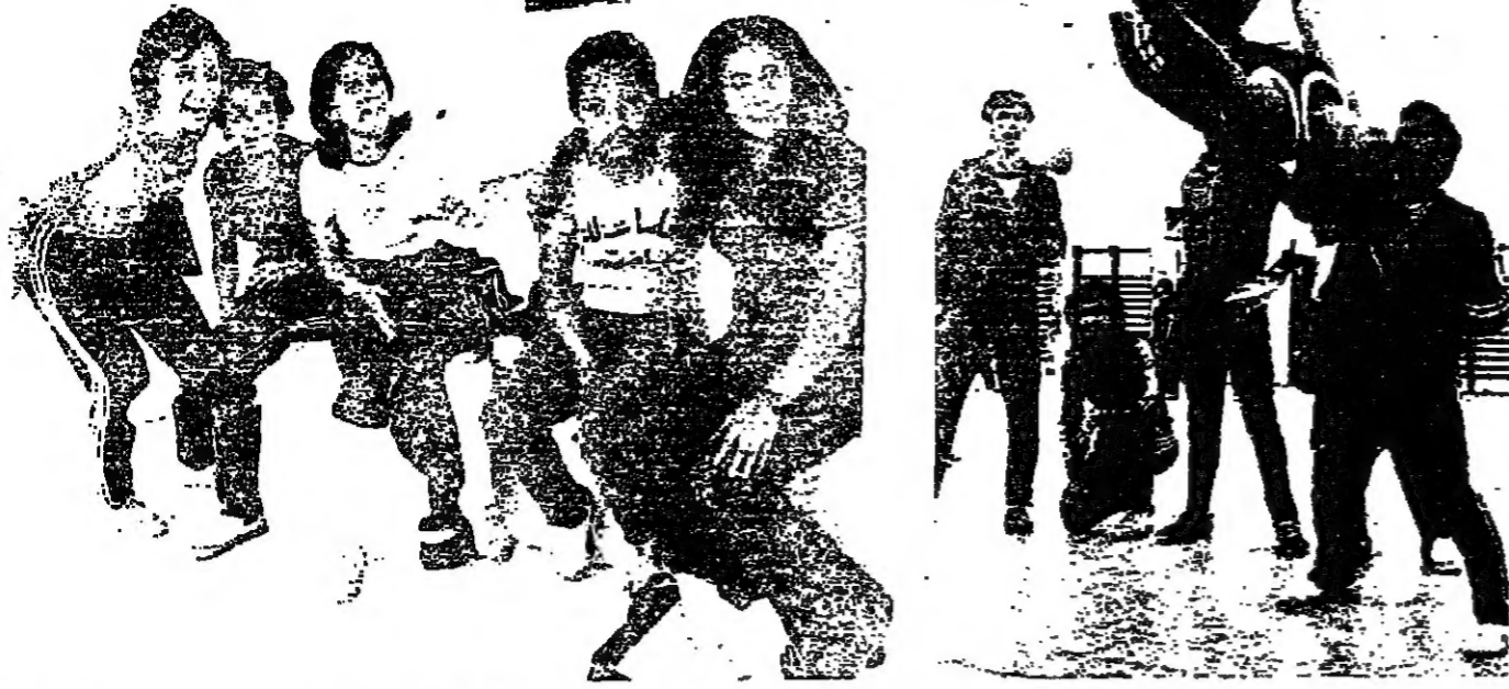
قاعة في الهواء خلال ترميم على اسراخه في اللعب